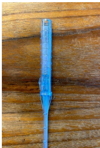
Fig. 2: Safety Wand utdragen med kanylskyddet på (vänster). Safety Wand helt infälld (höger).